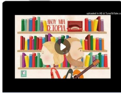
Άκου μια ιστορία - το παραμύθι με τα χρώματα