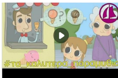
Βόλτα με τη Γιαγιά μαθαίνουμε τα χρώματα #τα_καλυτερα_παρ...